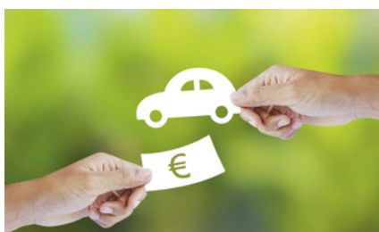
KFZ-Versicherung: Telematik-Tarife kommen auf den Markt