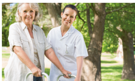
Absicherung des Pflegerisikos unter Berücksichtigung von Einmalprämien-Konzepten